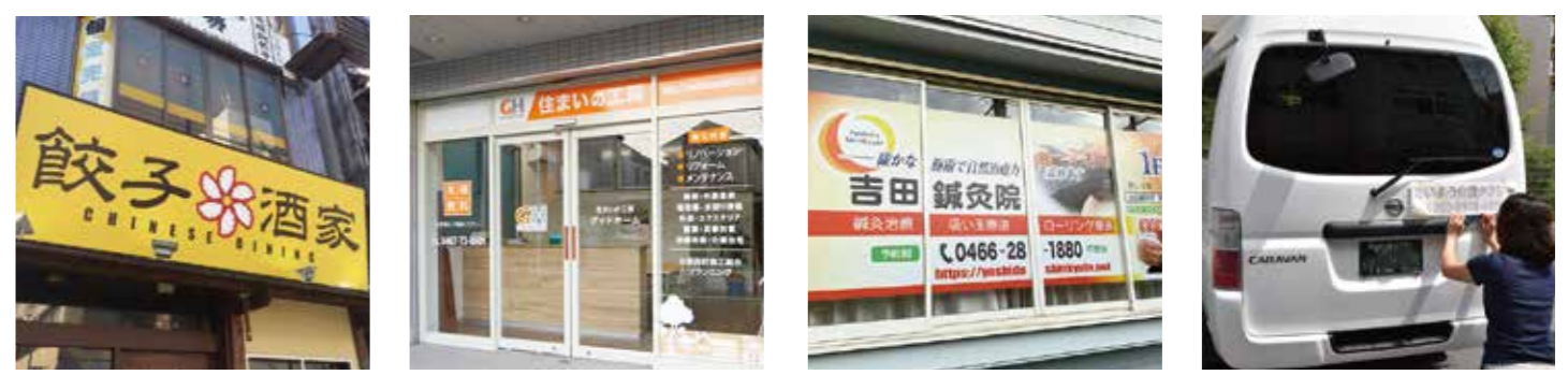
▲看板 ▲カッティングシート ▲CSシート ▲車両用カッティングシート

インサインとのパートナー事業として、看板やカッティングシートのデザイン、印刷、施工を行っております。完全版下入稿で印刷のみや施工なしの配送もOK。建築、デザイナー、不動産様など幅広いお客様からご利用いただいております。トータルディレクションもお任せください。