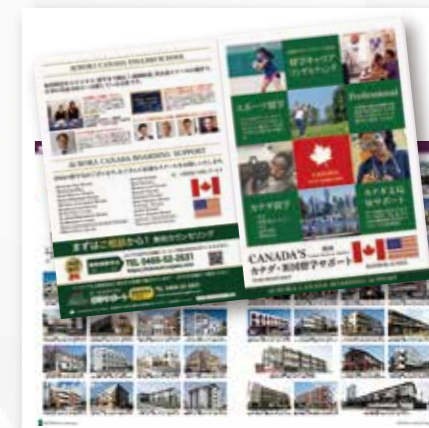
会社案内・パンフレット