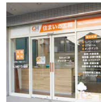
▲カットニングシート