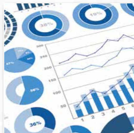
集客相談・助成金活用