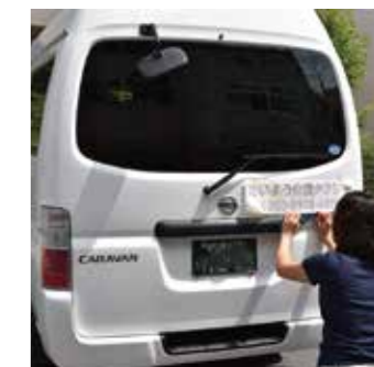
▲車両用カットニングシート

インサインとのパートナー事業として、看板やカットニングシートのデザイン、印刷、施工を行っております。完全版下入稿で印刷のみや施工なしの配送もOK。建築、デザイナー、不動産様など幅広いお客様からご利用いただいております。トータルディレクションもお任せください。