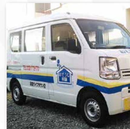
カットティングシート