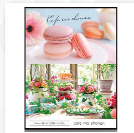
デジタルサイネージ デジタルポスター・動画