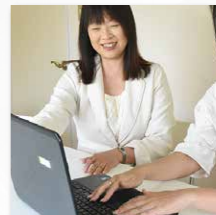
サイト更新レッスン