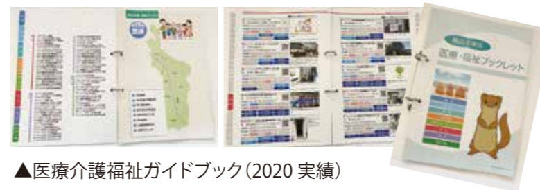
▲医療介護福祉ガイドブック(2020 実績)

地域新聞編集部の経験を生かし、広報誌や記念誌などを長年担当して参りました。印刷基礎知識はメーカーデザイン部時代より、工場立合いを担当。